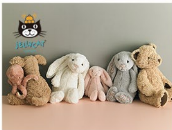
JELLYCAT(ジェリーキャット)

抱きしめて頬ずりをしたくなるような肌触りとユーモアに溢れたデザインが、世界中で愛されるロンドン発のぬいぐるみブランド。