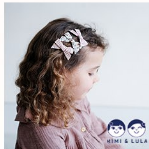
MIMI&LULA(ミミアンドルーラ)

抱きしめて頬ずりをしたくなるような肌触りとユーモアに溢れたデザインが、世界中で愛されるロンドン発のぬいぐるみブランド。