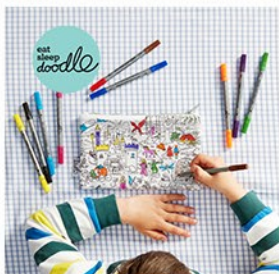
eatsleepdoodle (イトスリープドゥードル)

豊富なカラーバリエーションで、髪を結ぶだけでなくプレスレットとしても人気のロンドン発のヘアアクセサリブランド。